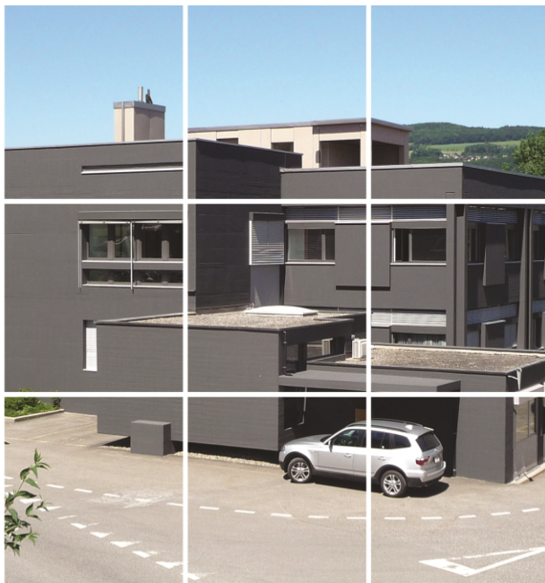
Aussenansicht Anbau nach der Fertigstellung