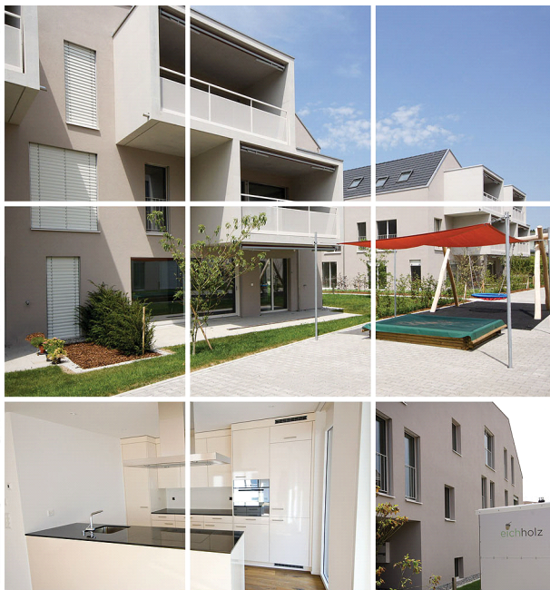
Aussen- und Innenansicht